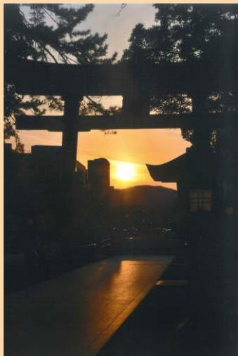
▲氣比神宮大鳥居の向こうへ沈んでいく夕日