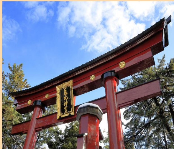
▲昨年12月に修復工事を納めた国の重要文化財である氣比神宮大鳥居